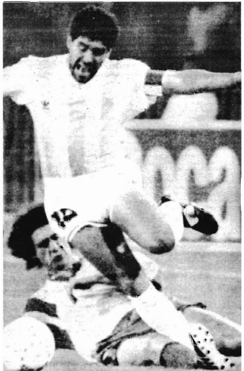
Die Schuhe, die seinen Namen tragen: Diego Maradona. Hier sehen wir ihn beim WM-Turnier im Spiel zwischen Argentinien und Rumänien in Aktion.