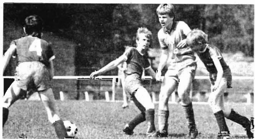
Den letzten Titelträger dieser Saison ermitteln die Schüler am Wochenende in Anklam.

Turbine Dresden, Karl-Stein-Gedenktournee – Knaben: 1. Viktoria 89, 2. Motor Heidenau, 3. Turbine Dresden, 4. Turbine Dresden II, 5. Traktor Radeburg, 6. Turbine Vetschau, 7. Chemie Coswig, 8. BSV 68 Sebnitz, 9. Turbine Großröhrsdorf. – Kinder: 1. Turbine Potsdam, 2. Turbine Dresden, 3. Chemie Coswig, 4. Viktoria 89, 5. Einheit Radebeul, 6. Turbine Großröhrsdorf, 7. Turbine Dresden II, 8. Turbine Halle, 9. SG Weixdorf, 10. BSV 68 Sebnitz. Lok Engelsdorf, 2. Kinderturnier: 1. Hertha BSC, 2. EAB Berlin 47, 3. BSV Borna, 4. Lok Delitzsch, 5. 1. FC Lok Leipzig, 6. TSG MAB Schkeuditz, 7. HFC Chemie, 8. Lok Engelsdorf, 9. Fortschritt LWK, 10. Lok Engelsdorf II. Aktivist Lauchhammer – Kinder: 1. Chemie Schwarzheide, 2. FSV Brieske-Senftenberg, 3. Stahl Riesa, 4. Aktivist Lauchhammer II, 5. Aktivist Lauchhammer. – Knaben: 1. Eisenhüttenstädter FC Stahl, 2. 1. FC Dynamo Dresden, 3. TSG Gröditz, 4. Tasmania Berlin, 5. Aktivist Lauchhammer. Chemie Torgau, Kinder: 1. FC Carl Zeiss Jena, 2. FSV Aktivist Brieske-Senftenberg, 3. 1. FC Lok Leipzig, 4. HFC Chemie, 5. Motor Hennigsdorf, 6. Chemie Torgau, 7. Chemie Buna-Schkopau. – Knaben: 1. Chemie Torgau, 2. Glassee Oschatz, 3. Chemie Buna Schkopau, 4. Motor Hennigsdorf, 5. 1. FC Lok Leipzig. Dynamo Gera, 24. Artur-Becker-Knabenturnier: 1. Wismut Gera, 2. FSV Zwickau, 3. Dynamo Gera, 4. Dynamo Dresden-Heide, 5. FC Wismut Aue, 6. Stahl Silbitz, 7. GW Schleiz, 8. Kreisauswahl Gera/AK 10.